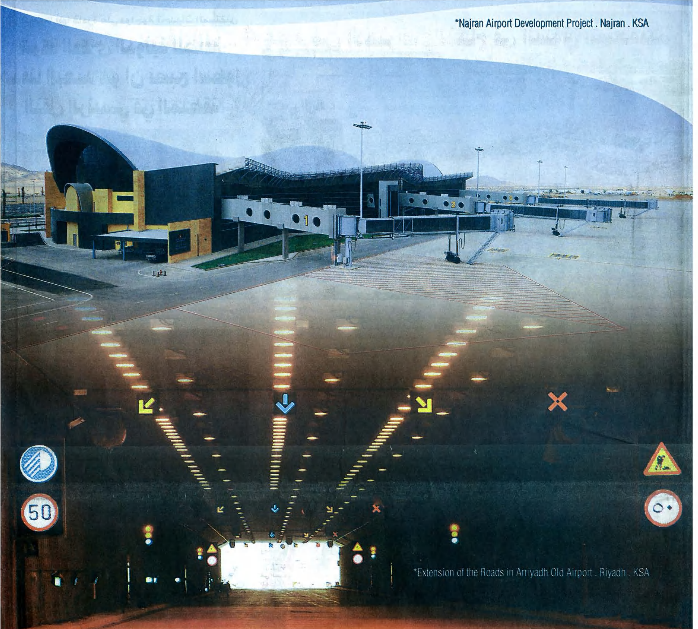
*Extension of the Roads in Arriyadh Old Airport . Riyadh . KSA